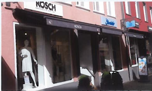
(Beispiel einheitlicher Sonnenschutz, Bad Münstereifel)

Zur Vergabe der Mittel wurde ein Entscheidungsgremium gegründet, das die Förderanträge unabhängig prüft und selbständig entscheidet. Wichtige Kriterien sind: Aufwertung des Ortskerns und des Kurparks durch die Maßnahme sowie Identifikation des Antragstellers mit dem Nümbrechter Ortskern.