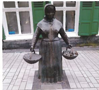
(Beispiel Kunst im Straßenraum, Wülfrath)

Hier können auch „kleine“ Projekte (innerhalb des nebenstehend dargestellten Sanierungsgebietes) die Attraktivität des Ortes steigern.